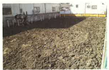
▲浄化した土地を売却

▲汚染された土地を 買い取り、化学酸化剤攪拌 ・浄化実績があったこと 混合(上)と、バイオ薬 も、BFMを選んだ決める 剤注入を組み合わせて浄 化する