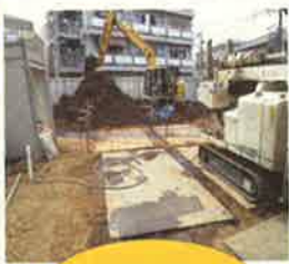
浄化工事 責任施工