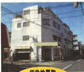
汚染地買取 瑕疵担保免責 現状有姿